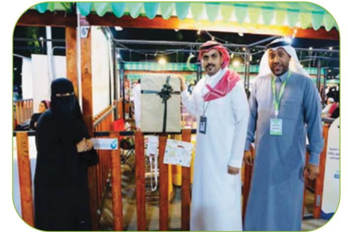
مسابقة أفضل جناح