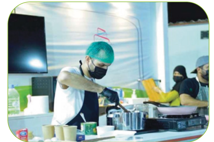
عروض الطبخ الحي