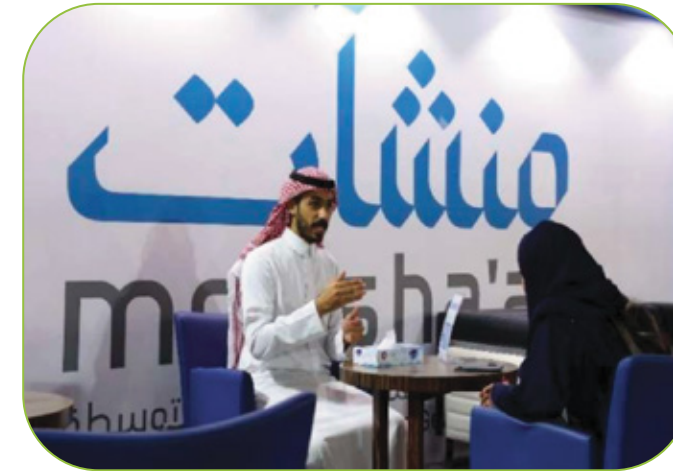
288 جلسة استشارية