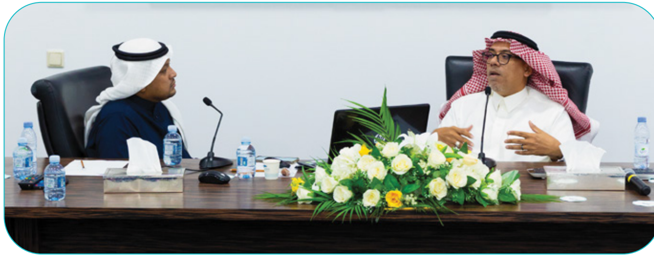
جلسة حوارية تمويل المشاريع الريادية

تهدف لتغطية احتياجاتهم التمويلية، نقل المعرفة الإدارية والفنية، وتسهيل النفاذ للسوق المحلي.