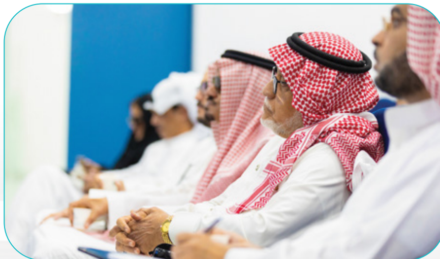
جانب من حضور ورش العمل