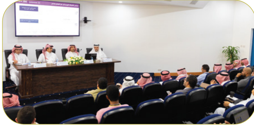
ورشة عمل مجلس الشراكة اللوجستي لاستعراض منصة لوجستي