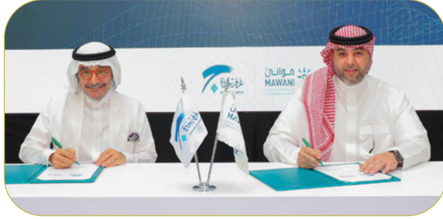
توقيع اتفاقية مع الهيئة العامة للموانئ لإنشاء منطقة لوجستية جديدة