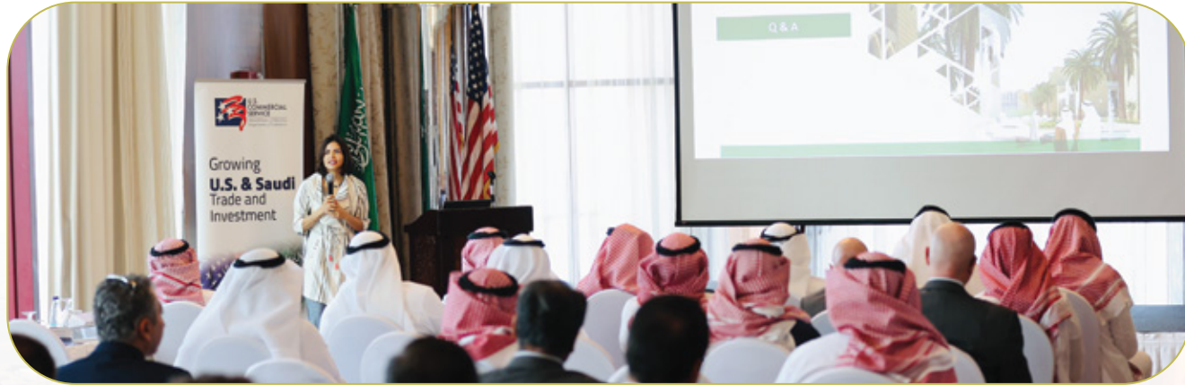
لقاء الشركات السعودية الأمريكية بقطاع النقل والخدمات اللوجستية