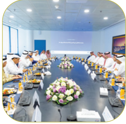
لقاء معالي رئيس هيئة الموانئ مع مجلس اللوجستيات