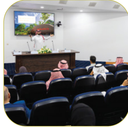
ورشة عمل تعريفية بمجموعة علي بابا الصينية للتعريف بالدعم والخدمات