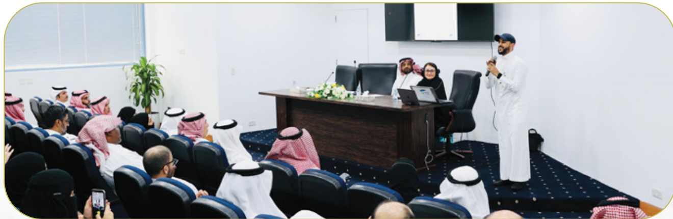
ورشة عمل توعوية عن أهمية التحول الرقمي في التدريب الاهلي والمعرض المصاحب لمعاهد التدريب