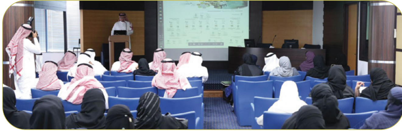
ورشة عمل مع إدارة الاستثمار والتخصيص بتعليم جدة