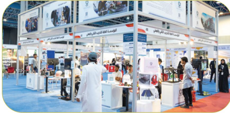
المشاركة في المعرض الدولي للتطوير والدعم التعليمي والتكنولوجي