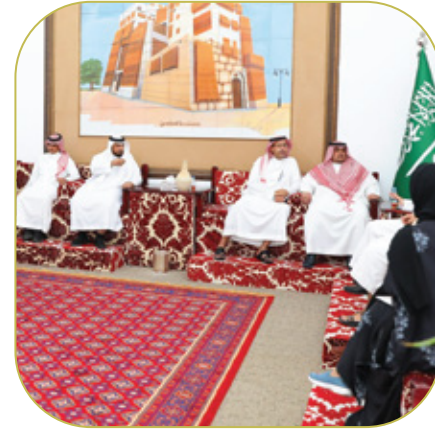
ورشة عمل مناقشة وحصر تحديات قطاع التدريب الاهلي والطلول المقترحة